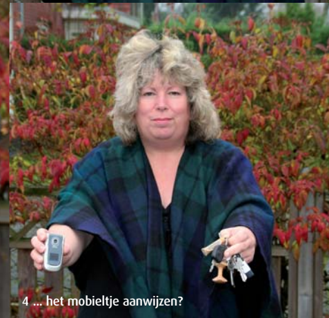
4 ... het mobieltje aanwijzen?

geweest met leren. Ik wil daarom nu verder geen druk op hem zetten, want ik wil niet dat hij terugvalt in zijn training.'