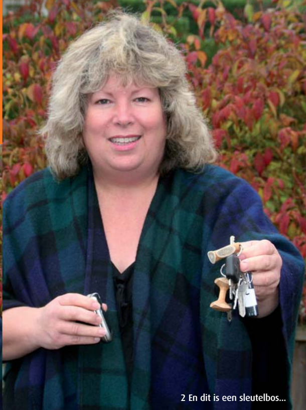
2 En dit is een sleutelbos...