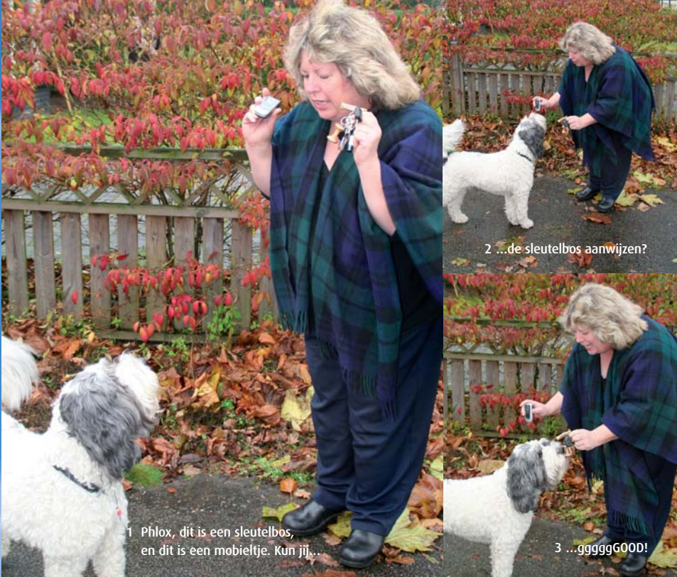
1 Phlox, dit is een sleutelbos, en dit is een mobieltje. Kun jij...