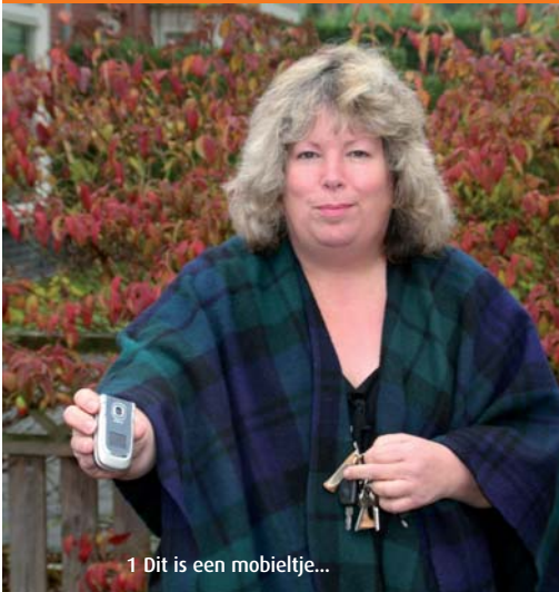
1 Dit is een mobieltje...

Lukt het u om uw hond voorwerpen te leren herkennen? Wijst hij ze goed aan, of juist helemaal niet? We horen graag uw ervaringen! Mail ons via redactie@hondenleven.eu